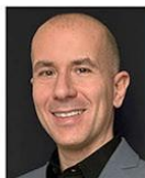
E. Rossi Scuole di Psicoterapia Cognitiva Ass. for Contextual Behavioral Science