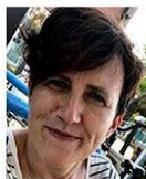
S. Moscatelli Università degli Studi di Bologna