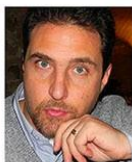
G. Romano Unimarconi Roma Scuole di Psicoterapia Cognitiva

Il Simposio è rivolto a Laureandi, Neolaureati, Psicologi, Medici, Psicoterapeuti, Psichiatri, Specializzandi.